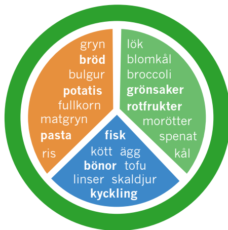
Tallriksmodell för den som rör sig enligt rekommendationerna på sidan 4.

Nyckelhålet ställer krav på fettmängd, fettkvalitet, fiberhalt och på hur mycket socker och salt ett livsmedel får innehålla. Det hjälper dig att välja hälsosamma livsmedel. Ät gärna mer frukt och grönt varje dag och välj fullkornsprodukter. Som törstsläckare kan du använda vatten smaksatt med frukt (citron-, apelsinskiva).